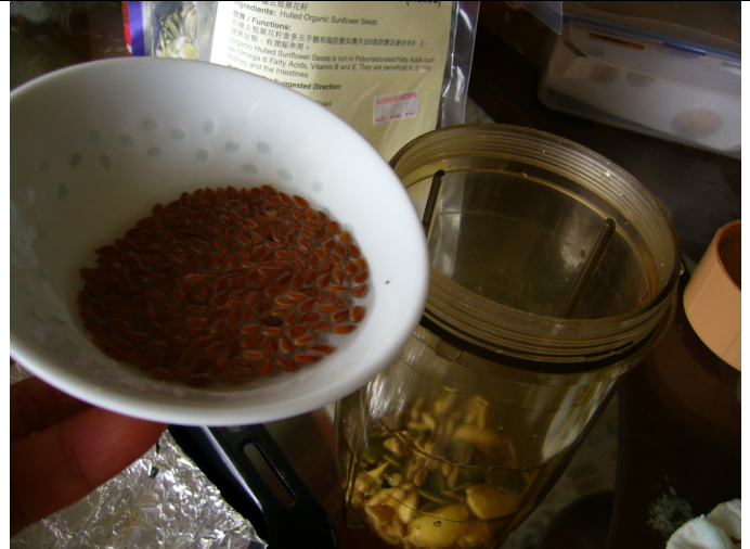
4) 加入清潔及浸約半小時的亞麻籽約 1 湯匙