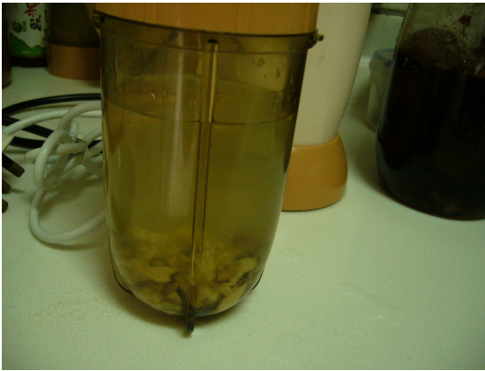
5) 加入清潔可飲用的“靚水”。