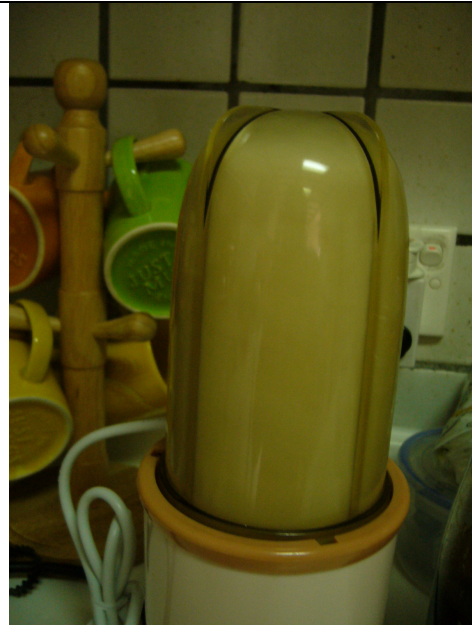
6) 放入攪拌器中每次開動 1 分鐘，打 2 - 3 次，即可飲用。