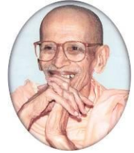
Swami Chidananda 慈達難陀大師