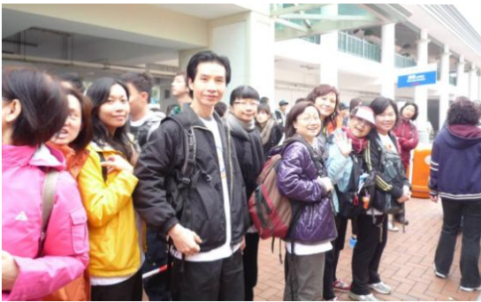
集合後排隊等候登車(大會安排)前往出發點。